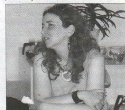
O projekt a zkušenosti sedlčanských maminek se zajímaly i zástupkyně dobříšského mateřského centra.

učebnu vybavenou počítači, chceme veřejnosti nabídnout i počítačové kurzy. Velký zájem byl o psychosociální témata seminářů - i v této oblasti se budeme snažit organizovat a nabízet další aktivity.“