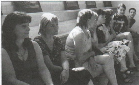
Po rozdání certifikátů byl prostor pro neformální besedu.